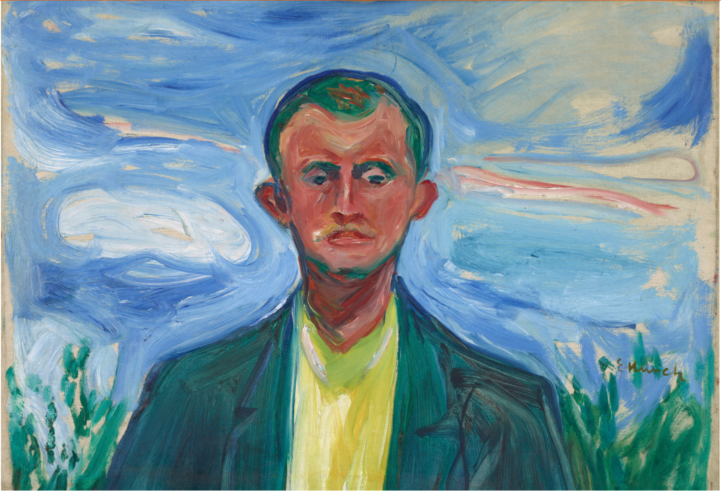
Edvard Munch, Selbstbildnis vor blauem Himmel, 1908, © Munchmusset, Oslo