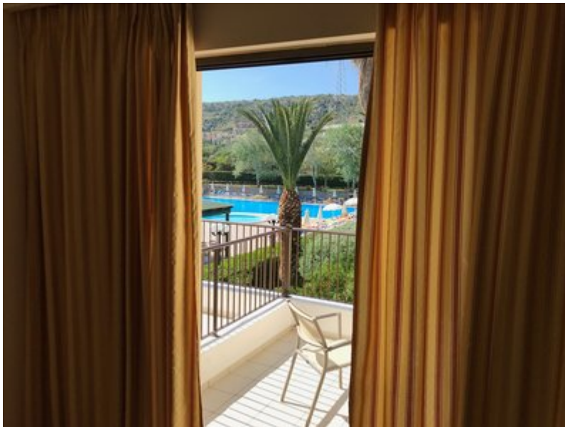
Wohnbeispiel Double LV