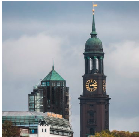
Michel: St. Michaelis

Nach einem reichhaltigen Frühstück im Hotel werden Sie vom örtlichen Gästeführer auf eine ausgiebige Stadtrundfahrt mit mehreren Ausstiegen mitgenommen. Hamburgs bekanntestes Wahrzeichen St. Michaelis , auch „Michel“ genannt, wird