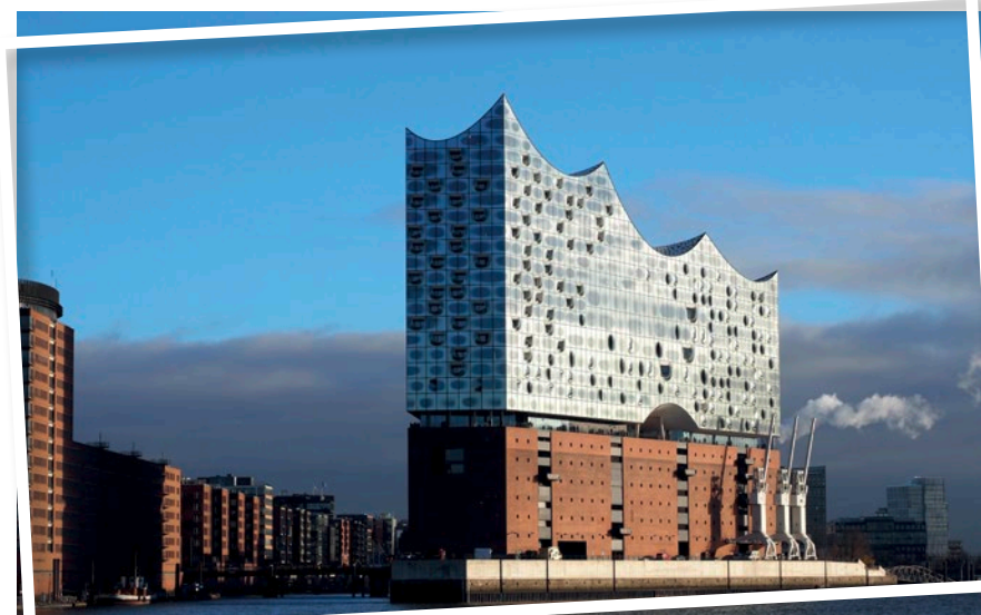
Elbphilharmonie Hamburg

SÜDWEST PRESSE Hapag-Lloyd Gemeinsam die Welt erleben!