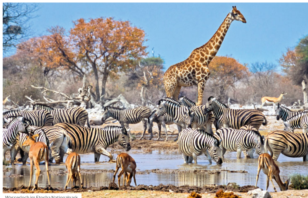
Wasserloch im Etosha Nationalpark