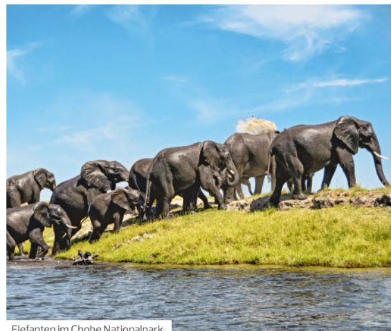
Elefanten im Chobe Nationalpark