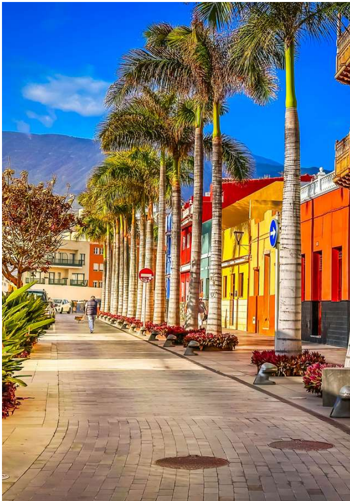
Puerto de la cruz

Einer der interessantesten Ausflüge Teneriffas steht auf dem Programm. Über das weitläufige Orotavatal führt uns die Fahrt in Richtung Cañadas del Teide und bietet herrliche Ausblicke auf das Tal. Auf rund 2100 m Höhe erreichen Sie den Nationalpark mit dem Wahrzeichen Teneriffas und höchster Berg Spaniens – der Vulkan Teide. In den Lorbeerwäldern am Außenrand des Kraters herrscht oft Nebel, während im wüstenähnlichen Innern fast immer die Sonne auf bizarre, vom Wind zu eigenartigen Formen geschliffenen Lavafelsen scheint - ein ungewöhnliches Naturerlebnis! Sie halten an verschiedenen Aussichtspunkten und an den bekannten Felsformationen Roques de García haben Sie Zeit für einen Rundgang um die auf bizarre, vom Wind zu eigenartigen Formen geschliffenen Lavafelsen aus der Nähe zu betrachten. Wenn es die Zeit erlaubt, halten Sie auf dem Rückweg am Besucherzentrum des Nationalparks, welches im angrenzenden botanischen Garten zahlreiche endemische Pflanzenarten beherbergt. Ca. 100 km (F, A)