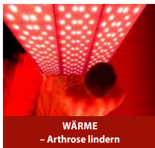
WÄRME – Arthrose lindern