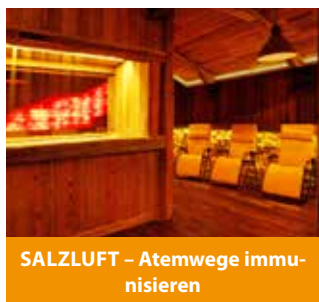
SALZLUFT – Atemwege immunisieren