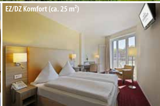
EZ/DZ Komfort (ca. 25 m 2 )