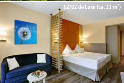
EZ/DZ de Luxe (ca. 32 m 2 )